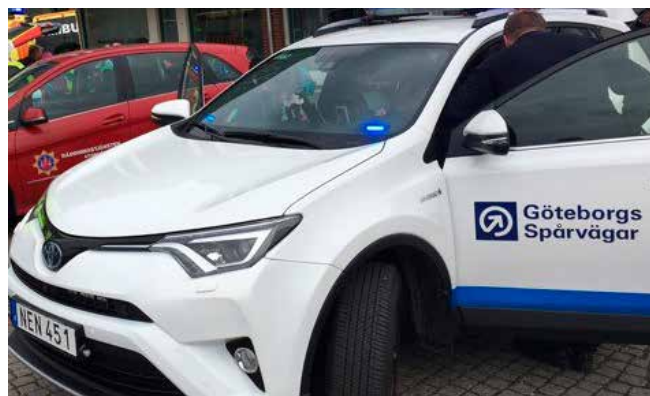
Under 2017 deltog Göteborgs Spårvägar i Blåljusdagen i Östra Göteborg, dit 400 mellanstadiebarn bjöds in för att få ökad kunskap om vad blåljuspersonal jobbar med.

För att se till att alla resenärer ska kunna åka med våra spårvagnar, arbetar vi kontinuerligt med att blanda äldre pedalvagnar med trappa (M28 och M29) och nyare spårvagnar med låggolv (M31 och M32) i trafiken. I den mån det är möjligt planerar vi för att minst varannan vagn på en linje ska vara tillgänglighetsanpassad eller att motsvarande sträcka täcks av vagn med låggolv från annan linje. Majoriteten av våra vagnar har låggolv. Vi strävar efter att öka antalet och när vi köper in nya vagnar är låggolv ett krav.