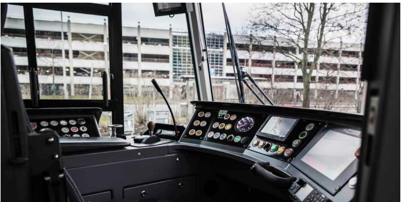
M33 – Göteborgs nya spårvagn.