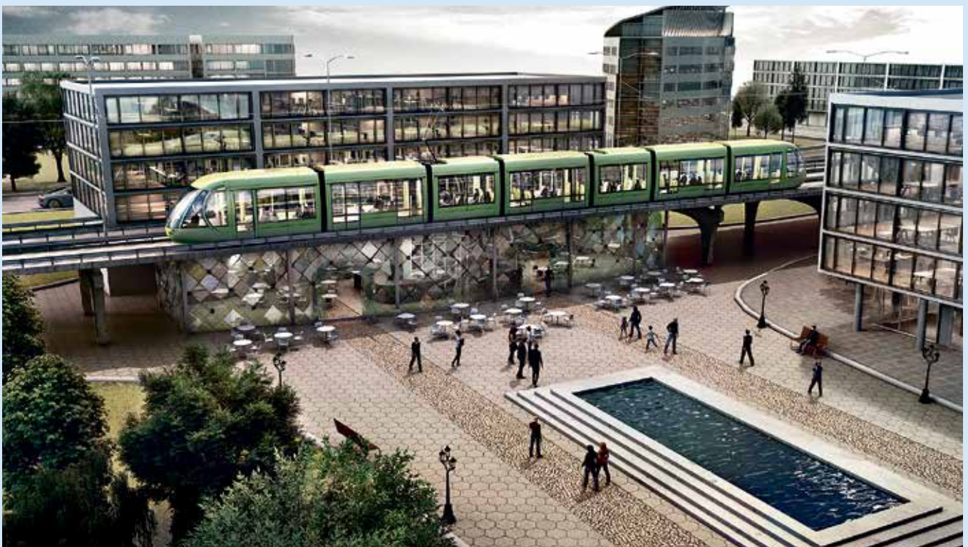
Stadsbana i stadsmiljö. Idébild/montage ur Målbild Koll 2035 om kollektivtrafikens utveckling. Västra Götalandsregionen.

I en redan trång stad full med spårvagnar och bussar blir det en spännande utmaning att vara en del i den expansionen. Kollektivtrafikens framtid är ljus.